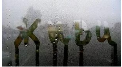
г. Заринск 2015