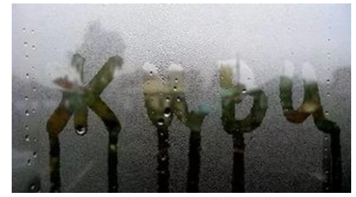
г. Заринск 2015

О влиянии курительных смесей на организм человека