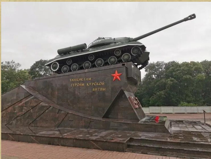
Памятник «Танкистам – героям Курской битвы»

В Курске в 1987 г. был установлен памятник «Танкистам – героям Курской битвы».