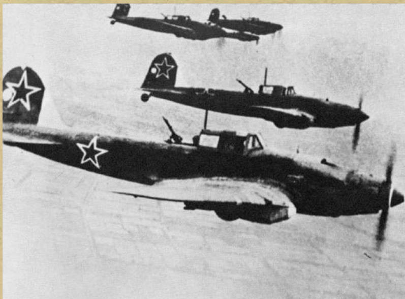
Ил-2 в Великую Отечественную войну

Суммарные потери «Люфтваффе» в небе над Курским выступом составили около 1700 самолетов, потери советских ВВС — свыше 1600 истребителей, штурмовиков и бомбардировщиков.