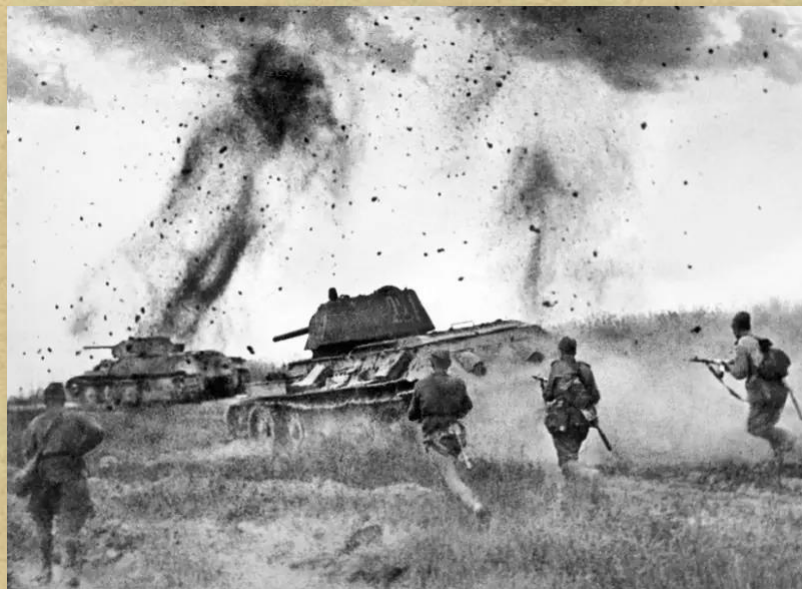
Атака Т-34 в районе Прохоровки

В районе станции Прохоровка состоялось крупнейшее танковое сражение, оказавшее влияние на весь ход Курской битвы.