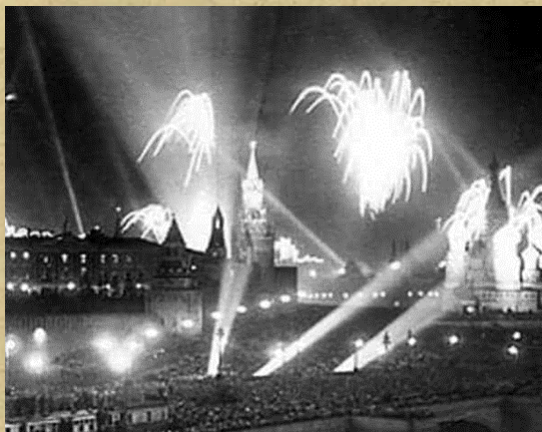
Салют в Москве 5 августа 1943 г.