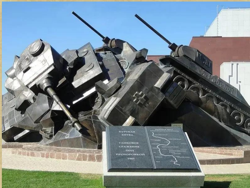
Монумент «Танковый таран» под Прохоровкой

В Белгородской области, у с. Прохоровка, где происходили самые напряженные танковые баталии, был установлен монумент «Танковый таран». Он является частью музея-заповедника «Прохоровское поле», сооруженного в 1995-2020 гг.