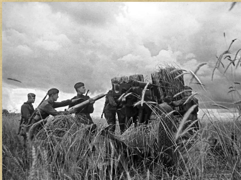
Расчёт советской зенитки под Курском

Ожесточенные бои, которые вели на севере советские артиллеристы и штурмовая авиация, в течение нескольких дней привели к потерям немцев в количестве 50 000 человек живой силы и свыше 400 танков.