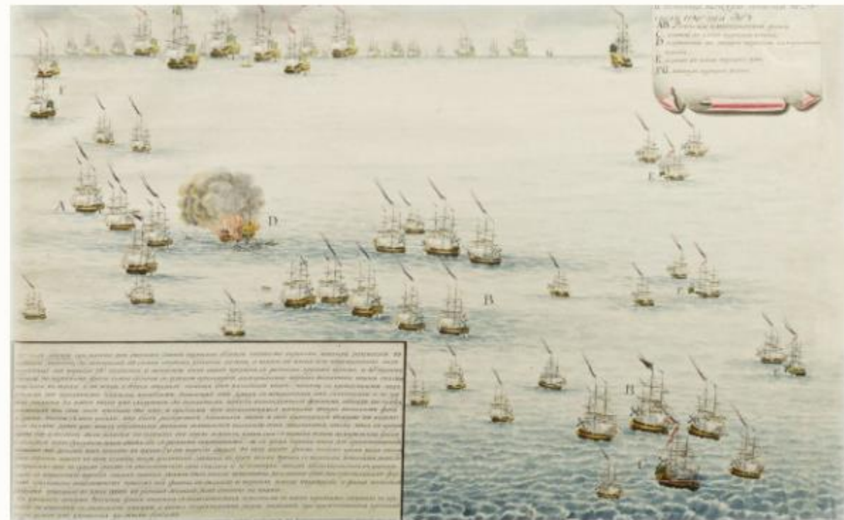
Сражение при Тендре. Под буквами А и В – российский флот, D – взорванный корабль турецкого командующего.

Приняв участие в общей сложности в 43 морских сражениях, Ушаков не проиграл ни одного. Мало того, он не потерял ни одного корабля, и ни один из его матросов не попал в плен. Подготовке последних флотоводец уделял особое внимание, придерживаясь суворовских принципов. Матросы и канониры проходили особые тренировки — например, стреляли по парусу, установленному в море на деревянном щите, из орудия, которое стояло на своего рода качелях из канатов. Такая конструкция успешно имитировала качку, позволяя подчиненным Ушакова в реальном бою демонстрировать невиданную артиллерийскую точность.