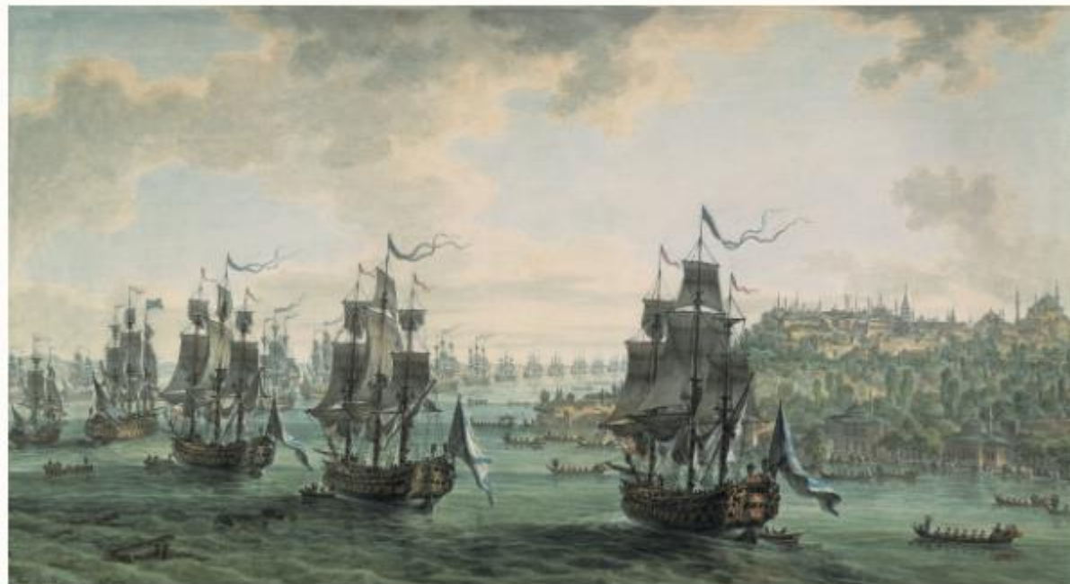
Русский флот прибыл в Стамбул в рамках турецко-русского союзного договора, 1799 год.

В результате этих строгих, но разумных мер уже к началу ноября с чумой в команде Ушакова было покончено. Императрица получила доклад, упоминавший, помимо прочего, и адмирала, который «ту болезнь во вверенной ему части, не допуская ее к большому распространению, пресек совершенно, гораздо скорее других командиров». В других командах люди страдали от эпидемии еще несколько месяцев — до весны 1784 года.