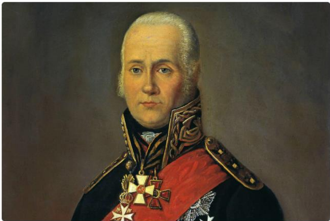
Портрет Ф. Ушакова работы Петра Бажанова, 1912 г. Центральный военно-морской музей. Санкт-Петербург

В ходе беспорядочного отступления турки потеряли 5,5 тыс. человек, тогда как на счету русских было всего 21 убитый и 25 раненых. Григорий Потемкин так отозвался об этом сражении: «Наши, благодаря Бога, такого перца задали туркам, что любо. Спасибо Федору Федоровичу!»