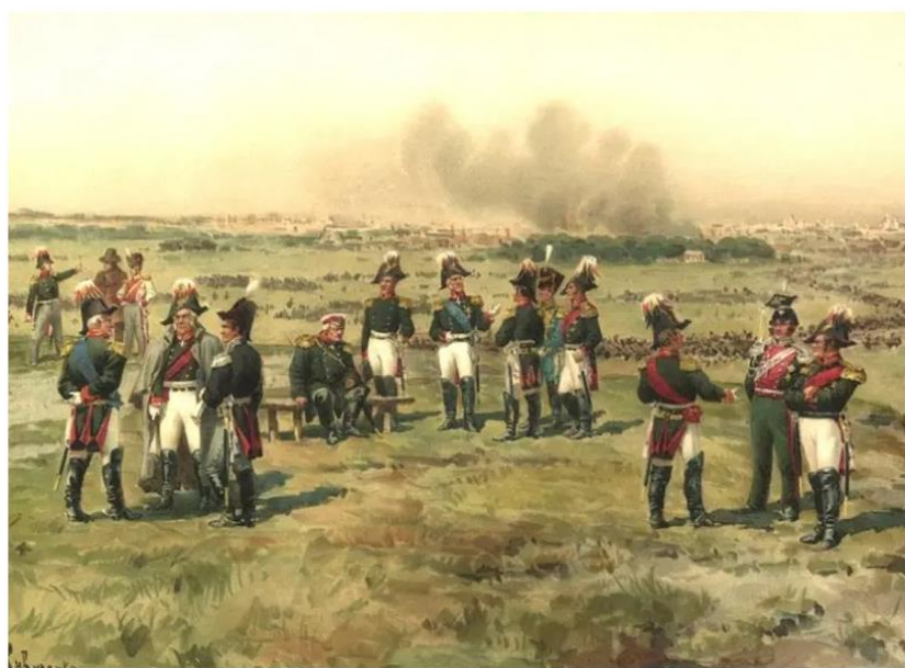
Кутузов на Поклонной горе перед советом в Филях

Бородинское сражение 7 сентября между русскими и французскими силами фактически кончилось вничью: потери противников в 12-часовой битве оказались почти равными. Кутузов принял решение сохранить остатки армии