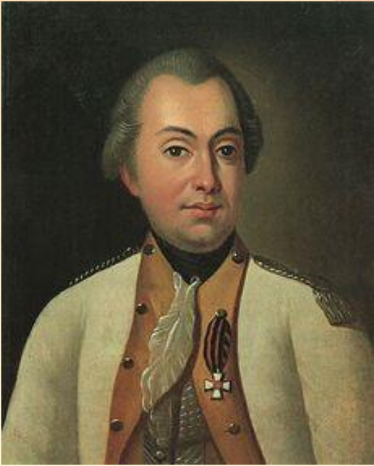
Портрет М. И. Кутузова в мундире полковника Луганского пикинёрного полка . Около 1777 г.

Михаил Илларионович хорошо понимал, что значит пройти «суворовскую школу». Ещё через два года Кутузов – Генерал-майор. В его подчинении егерский корпус – лёгкая стрелковая пехота.