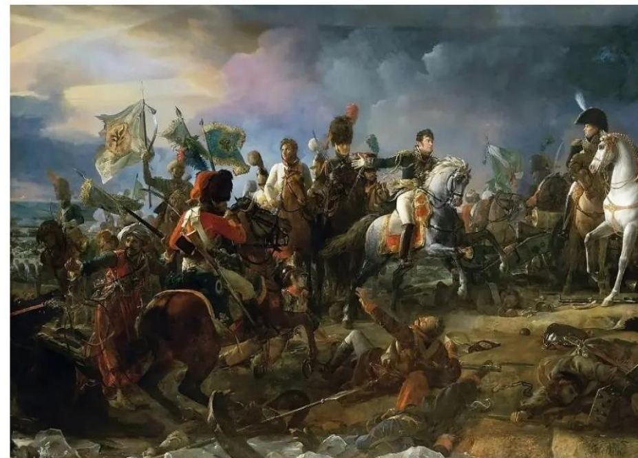
Наполеон Бонапарт, Аустерлицкое сражение 1805 г.

Однако императоры Александр I и Франц II, считая залогом победы небольшое численное преимущество союзных войск (85 000 человек) над французами (74 000 солдат), отправили их в наступление. В результате битвы под Аустерлицем 20 ноября 1805 г. русско-австрийские войска потерпели сокрушительное поражение. Впервые со времен Петра I русские проиграли генеральное сражение, императоры Александр и Франц бежали с поля боя еще до его завершения, а раненый осколком Кутузов едва спасся от пленения.