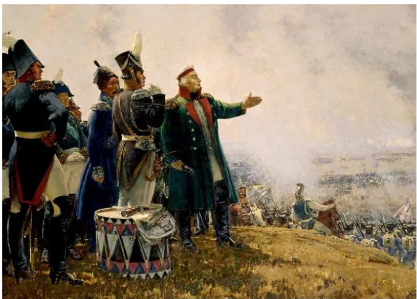
Кутузов на Бородинском поле, картина С.В. Герасимова, 1952 г.

Кутузов, будучи мудрым дипломатом, сумел склонить Турцию к выгодным для России условиям. Для заключения Бухарестского мирного договора он убедил османов, что если Александр I и Наполеон помирятся, то просто разделят Турцию между своими империями. Турки не стали дожидаться нападения Наполеона на Россию и исхода новой войны, пойдя на мировую. За это российский император присвоил М.И. Кутузову титул «светлейшего князя».